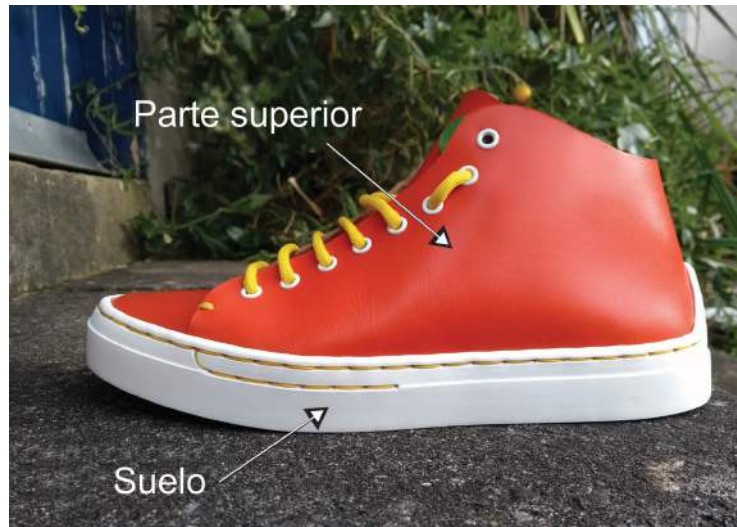
Figura 2: Zapatilla Greenfeet Vertue