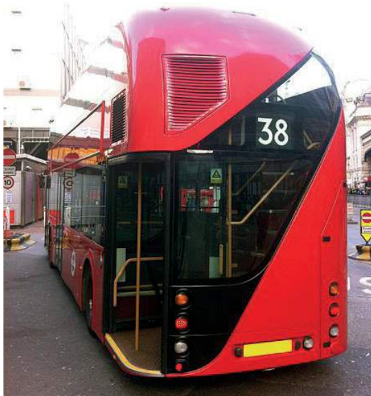
Figura 8: Autobús Routemaster