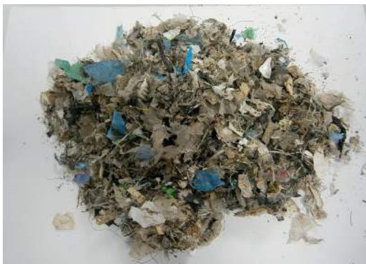
Figura 10: Bolsas de plástico trituradas