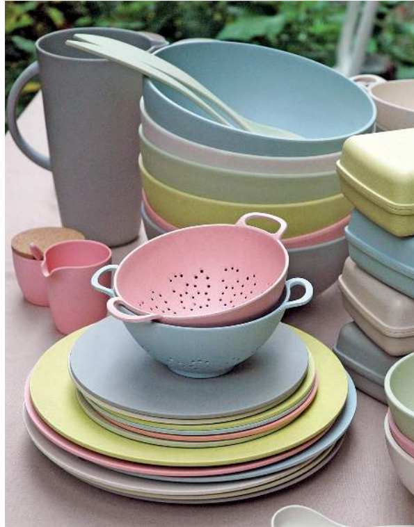
Figura 14: Varios utensilios de cocina de Zuperzozial