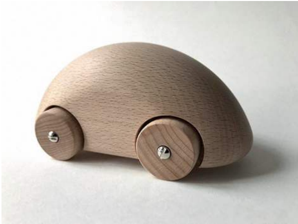
Figura 5: Cuerpo del vehículo de madera Playsam Streamliner Classic