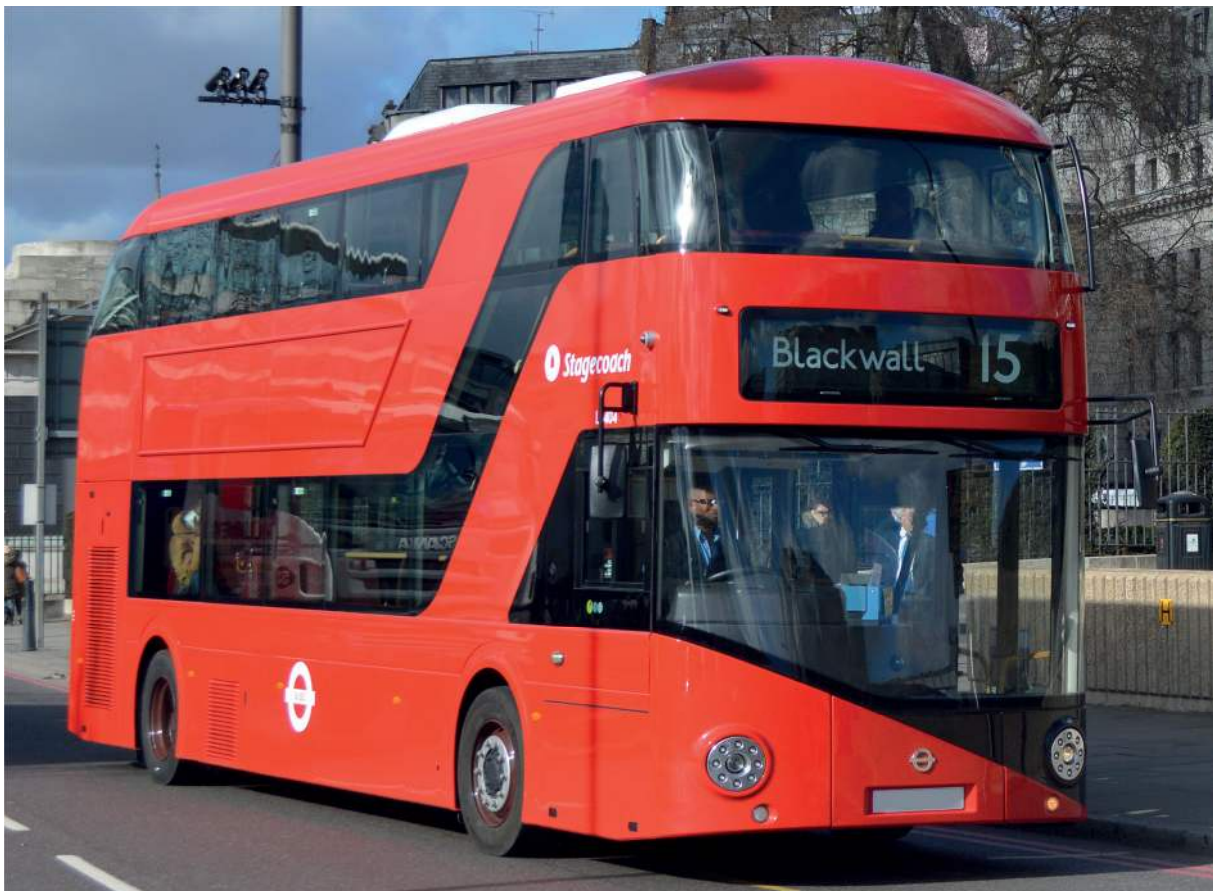
Figura 7: Nuevo autobús Routemaster