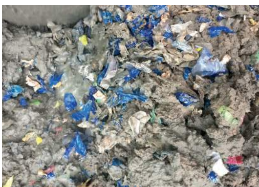
Figura 11: Plástico triturado añadido al hormigón