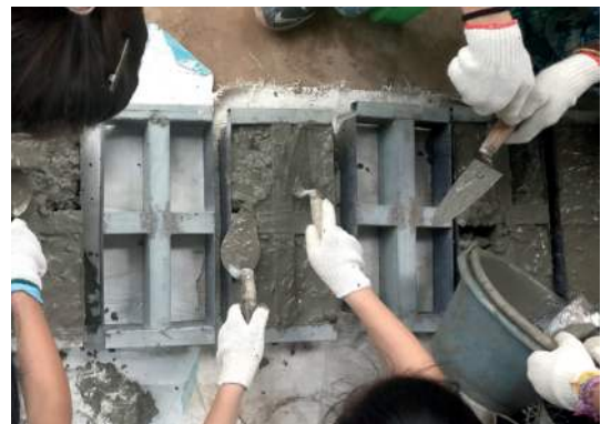
Figura 12: Hormigón siendo moldeado en ladrillos